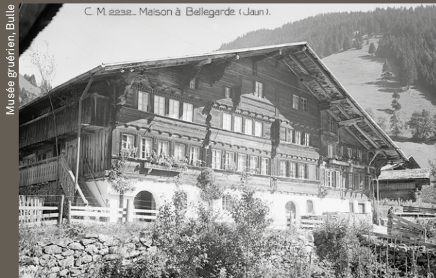
Haus in Jaun, Charles Morel, 1937