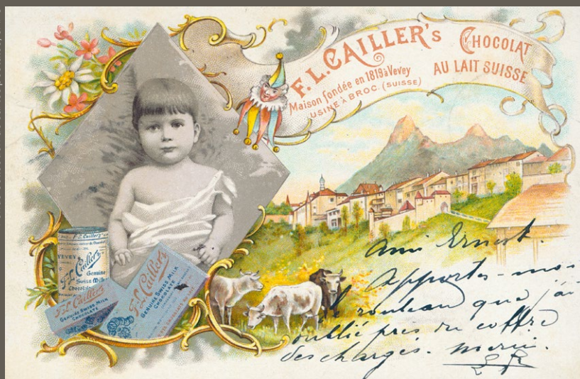
F.L. Cailler's, maison fondée en 1819 à Vevey, usine à Broc (Suisse), carte postale, avant 1899

Bibliothèque cantonale et universitaire de Fribourg, Fonds Collection de cartes postales, CAPO