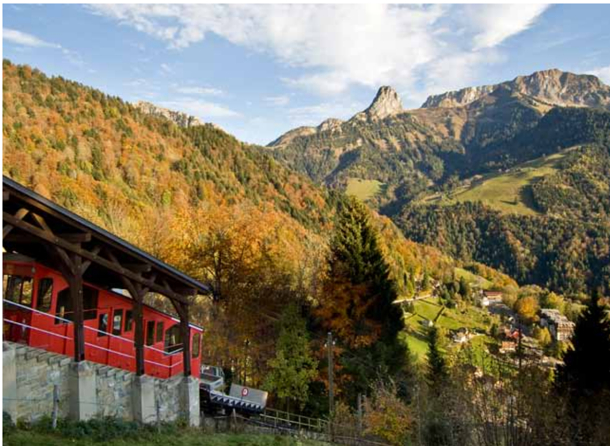
Le funiculaire Les Avants - Sonloup avec une vue magnifique sur la Dent de Jaman