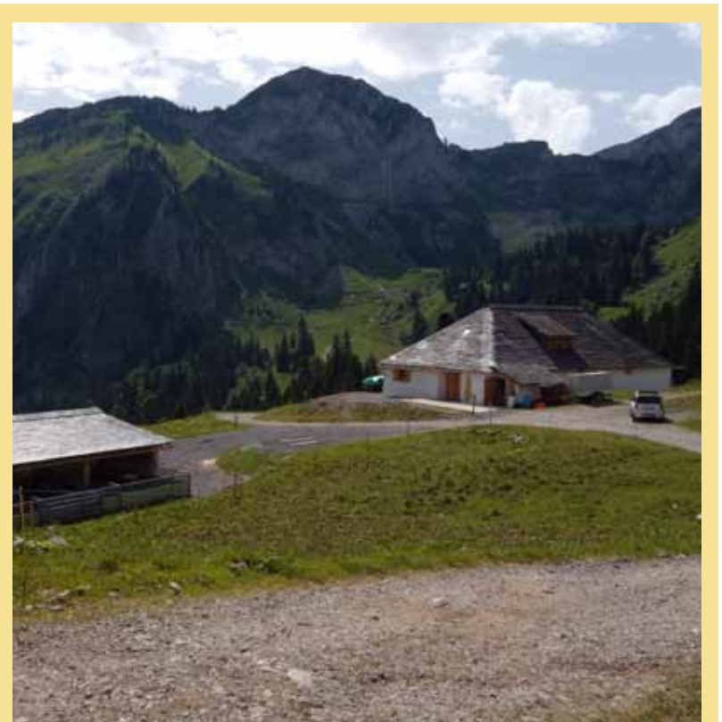
Au col de Jaman, le chalet du Revon fabriqué du Jaman. On en dégustera sur le stand du Parc