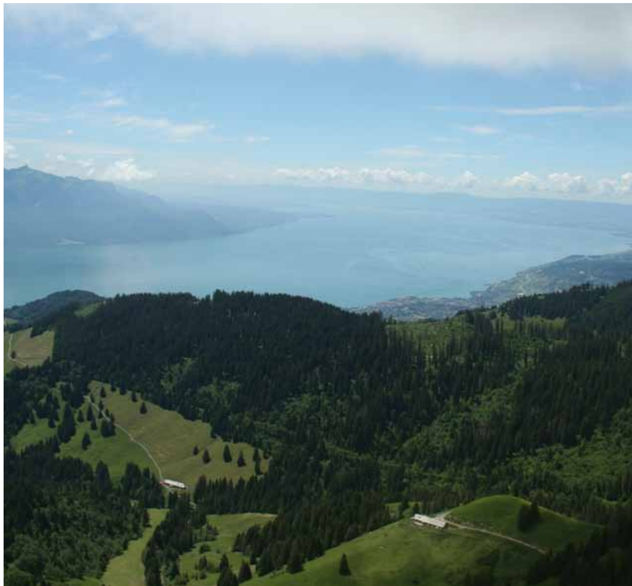
Forêts, alpages et chalets (Soladier et Les Pontets) sur fond de lac Léman