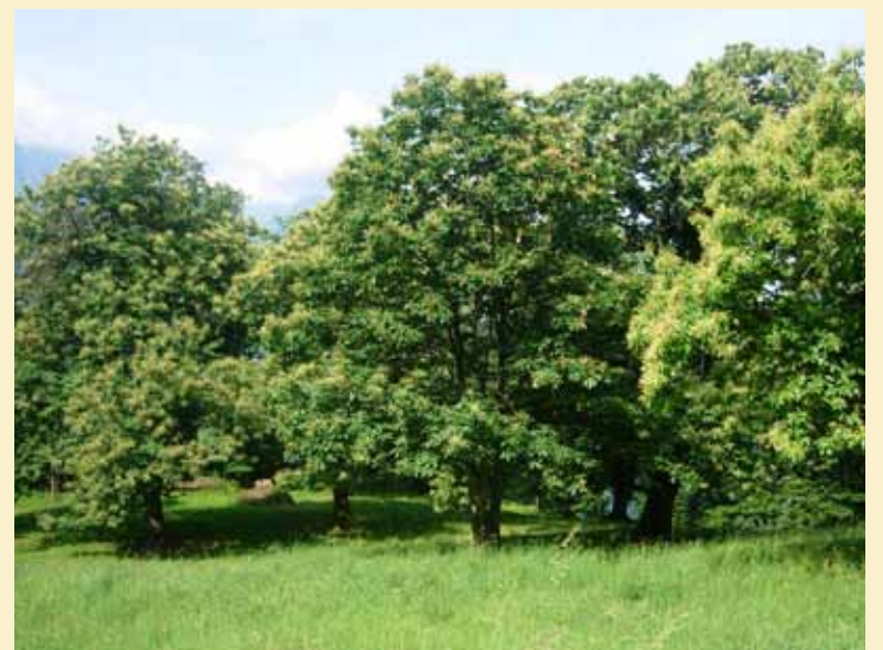
La châtaigneraie de Montolivet - Chenaux sur la commune de Villeneuve

Originaire d'Asie, le châtaignier a été introduit par les Romains en Europe. Les variétés fruitières se sont multipliées par greffage. Il affectionne les régions tempérées en dessous de 1000 m et ne supporte que très mal les sols calcaires et mal drainés. Il se développe en des lieux propices à la forêt appelés selves, mais sans entretien, la forêt prend le dessus et les châtaigniers disparaissent.